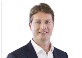
Ola Källenius, Daimler