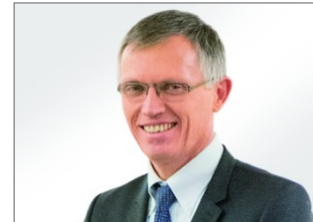
Carlos Tavares, PSA