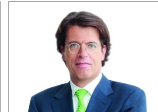
Klaus Rosenfeld Schaeffler