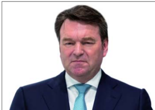
Bram Schot, Audi