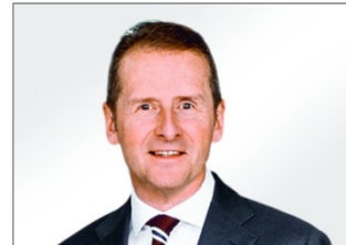
Herbert Diess, Volkswagen