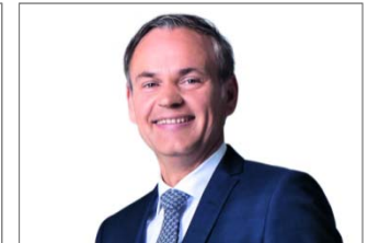
Oliver Blume Porsche