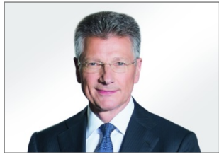
Elmar Degenhart, Continental